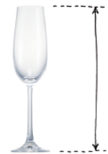
フルート型グラス

ジャーマン・ピルスナーの魅力を引き立てるには、専用のピルスナーグラスもありますが、フルート型グラスもおすすです。通常のグラスに比べて細くて高さがあるので、グラスにビールを注ぐと、キメ細やかな泡が生まれてアロマが泡下から立ち上ります。細身のグラスが映し出す明るい黄金色も、気分を高めてくれますね。